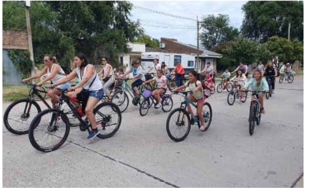
dades solidarias para que los repartan entre niños y niñas carenciadas.