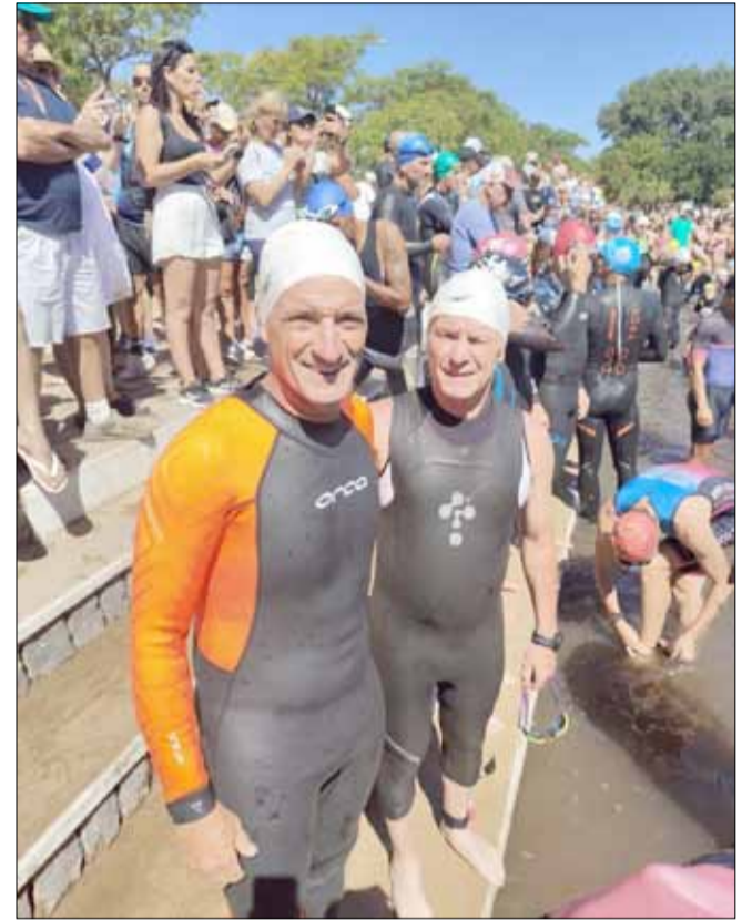
La dupla local, a punto de largar.

Nos fue bien. La largada es siempre apretada, te vas pegando con los otros corredores hasta que se "estira" un poco pelotón. Igualmente nadamos muy bien; después la parte de bicicleta se hizo muy linda, con viento de costado pero se pudo rodar bastante bien, y luego el tramo de trote me dejó muy contento porque corrí a un ritmo que no pensé tener y logré mantenerlo. Fueron cinco kilómetros, pero es una distancia que no estamos entrenando porque siempre nos preparamos para triatlones de distancias más largas... Un "Half" o "Medio Ironman" tiene 1.900 metros de natación, 90 kilómetros de bicicleta y 21 kilómetros de trote, o un "Full",